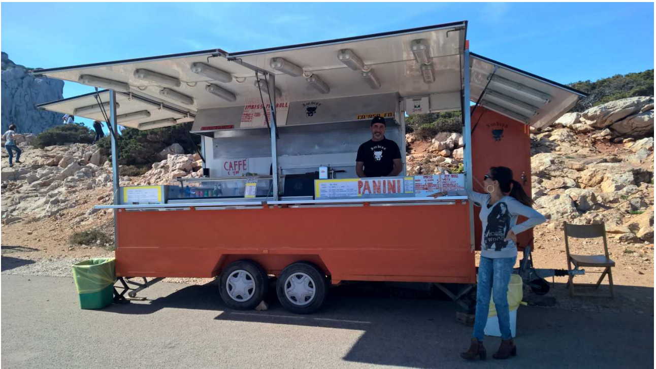
04/10/2015 Capo Caccia foto ricordo del chiosco o ..... della ragazza