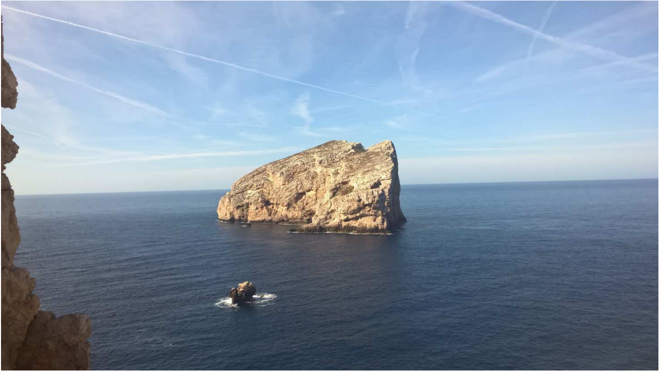
04/10/2015 Sulla strada per Capo Caccia Panorama