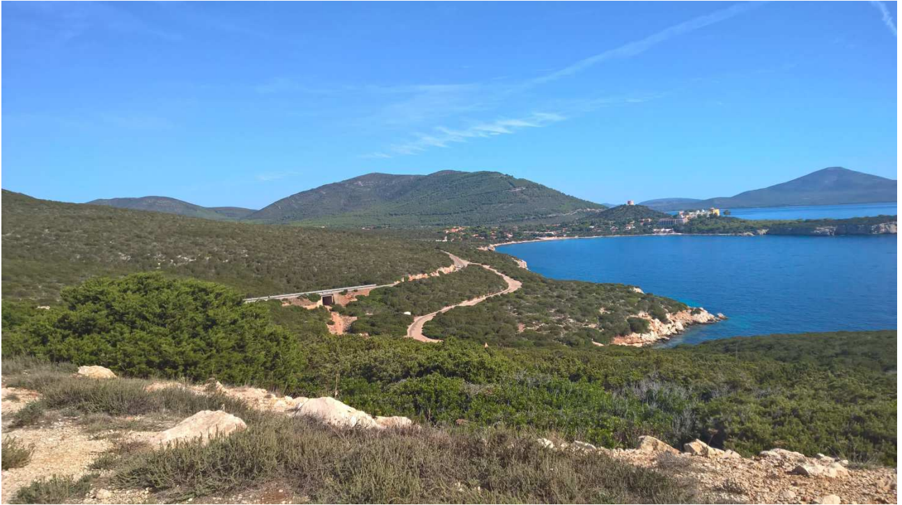
04/10/2015 Sulla strada per Capo Caccia Panorama