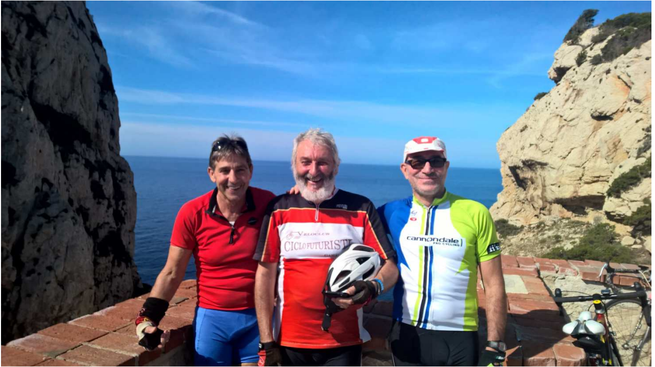
04/10/2015 Capo Caccia foto ricordo