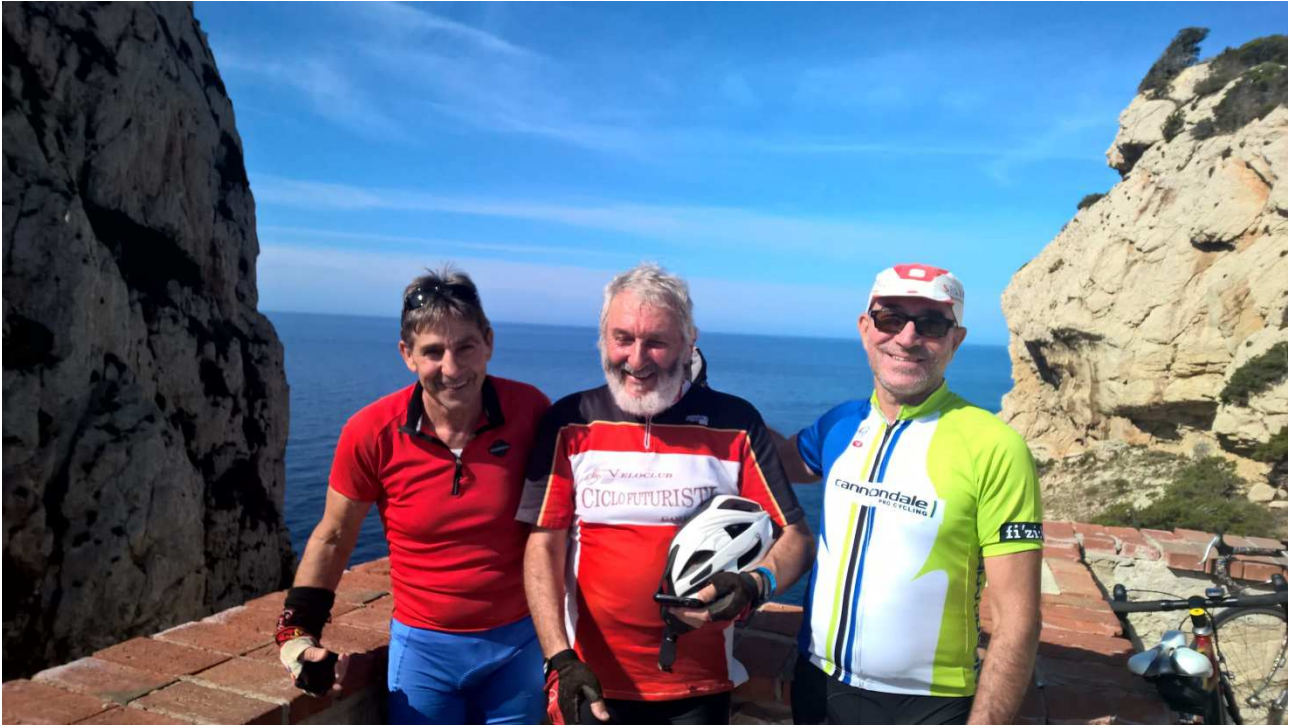
04/10/2015 Capo Caccia foto ricordo