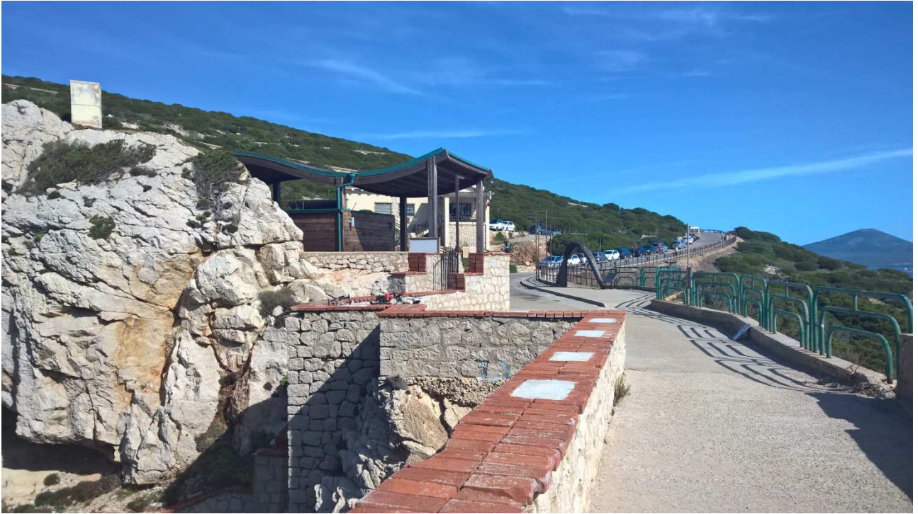
04/10/2015 Capo Caccia