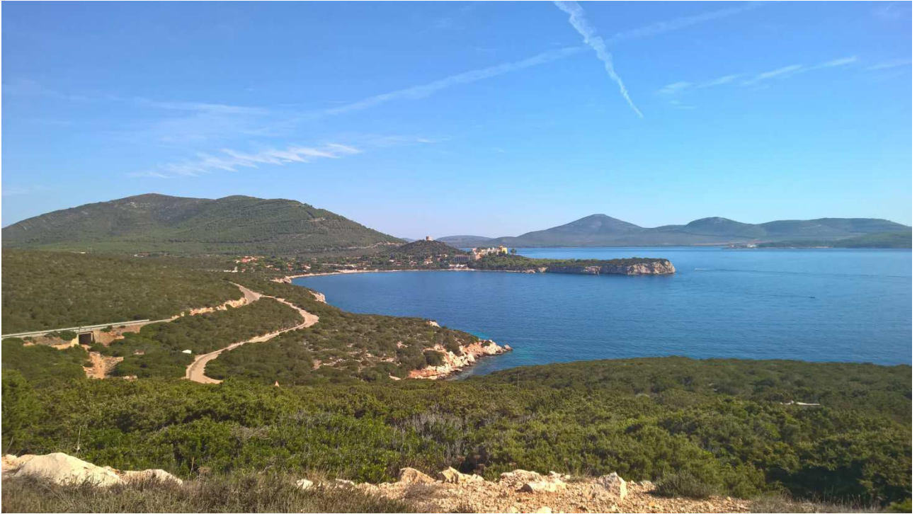
04/10/2015 Sulla strada per Capo Caccia Panorama