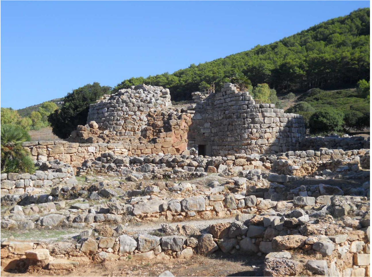
04/10/2015 Sulla strada per Capo Caccia Resti di un Nuraghe