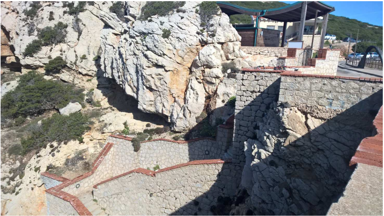
04/10/2015 Capo Caccia Alcuni dei 1000 e più gradini per la Grotta do Nettuno