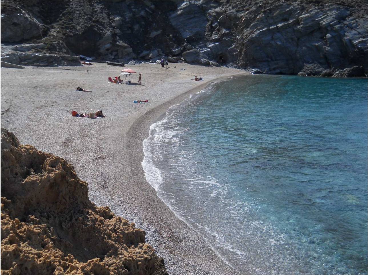
04/10/2015 Argentiera la spiaggetta