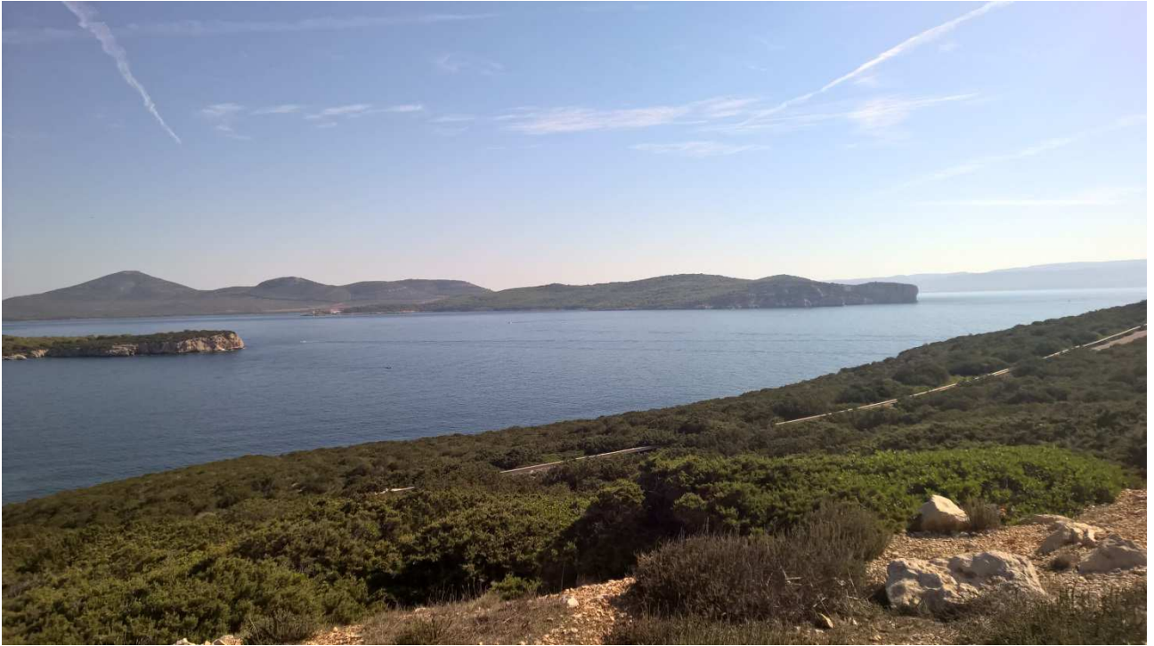
04/10/2015 Sulla strada per Capo Caccia Panorama