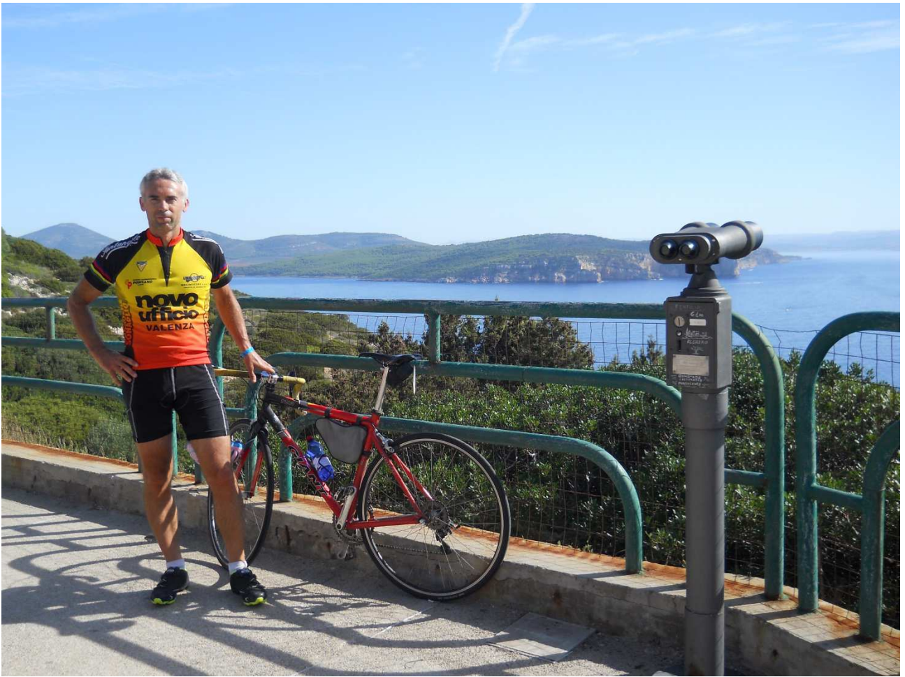
04/10/2015 Capo Caccia foto ricordo